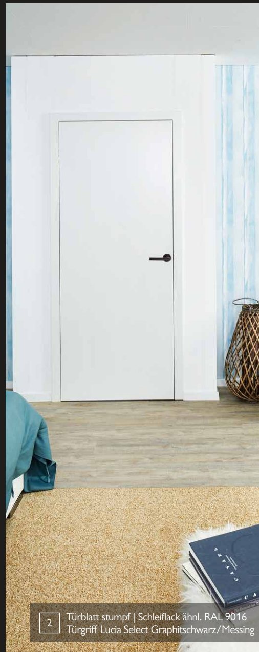
2 Türblatt stumpf | Schleifack ähnl. RAL 9016 Türgriff Lucia Select Graphitschwarz/Messing