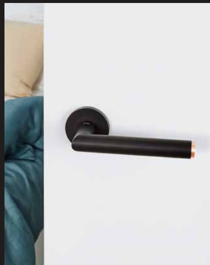
Türdrücker Lucia Select Graphitschwarz/Kupfer Schraubrossette