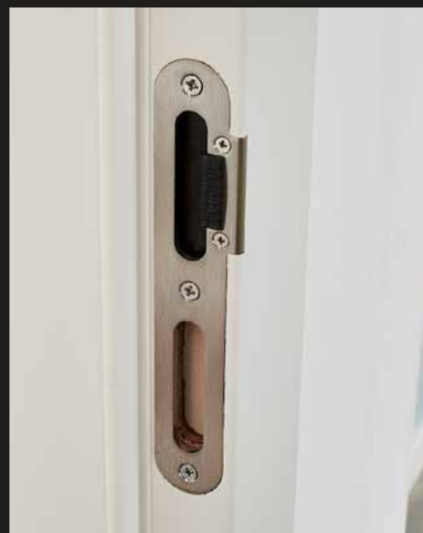
Detail: Magnetfallschließblech zum Verstellen