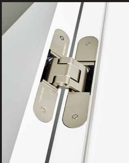
Detail: verdecktes Tectus Türband mit lackiertem Türfalz