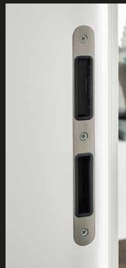
Verdeckt liegendes Magnetfallenschließblech

1 Türblatt REVERSE stumpf | Weißlack 9016, ohne SLB Türzarge PZ 14 REVERSE stumpf | Weißlack 9016 Türdrücker TASMANIA ER31 Schraubsetze eckig | Edelstahl matt