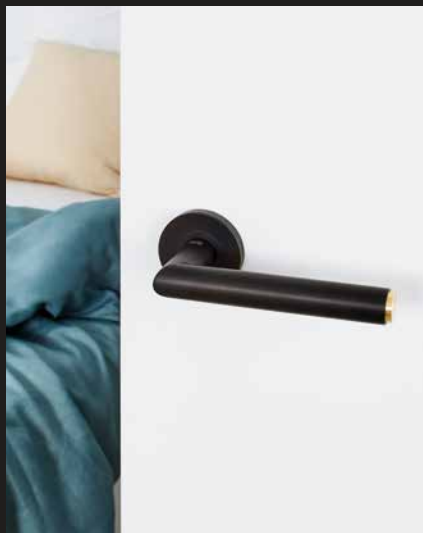
Türdrücker Lucia Select Graphitschwarz/Messing Schraubrossette