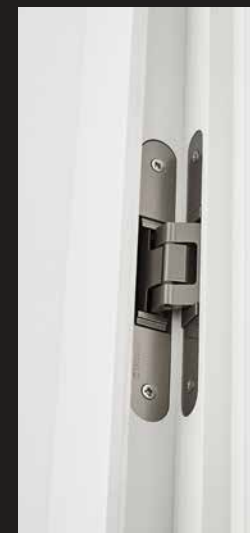
Tectus TE240 | reverse öffnend (durch die Leibung)