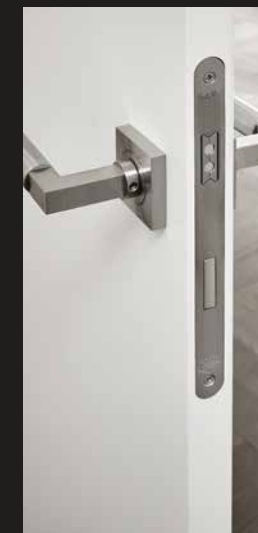
Magnetschloss Drücker Tasmania ER31 Q